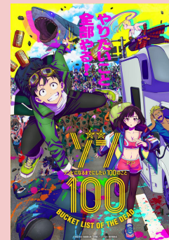
ゾン100～ゾンビになるまでにしたい100のこと～